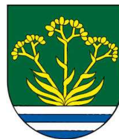
Obec Nižná Sitnica